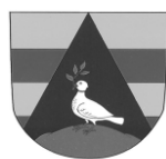
MĚSTO NÁMĚŠŤ N. OSL.